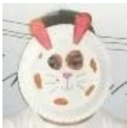
S. Pölzerová, 4.tř.

Dne 31.1.2013 jsme měli Masopustní učení . Povídali jsme si o masopustu - u nás na Moravě o fašaňku. Dělali jsme si masky na masopustní průvod a obcházeli jsme třídy, zpívali jsme si „Stála basa u primasa, za kamnama stála“. E.Urbánková