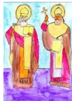
Kateřina Bohunská, 7.tř.

Na konci měsíce května se naše škola připojila k akci Setkání kultur, která probíhala na Slovanském hradišti na počest 1150.výročí příchodu Cyrila a Metoděje na Moravu. Děti ze Základní školy vytvořily na téma Cyril a Metoděj krásné kalendářiky, omalovánky a plátěné pytlíky. Největší chloubou školy pak byly papírové sochy Cyrila a Metoděje, které vlastnoručně vyrobili žáci 3. a 4. třídy.