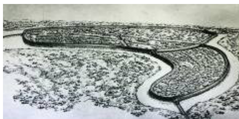
(J. Strážnický, 4. tř.)

PS. Ukážu vám, jak naše působiště vypadá z nejvyššího místa Slovanského hradiště. Pokusím se vám to namalovat- vypadá to zhruba takto: