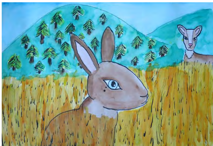
Simona Březinová, 7.tř.

Bělohoubek. Výbornou tělesnou zdatnost 8 závodníků. Maximální počet bodů byl 120.