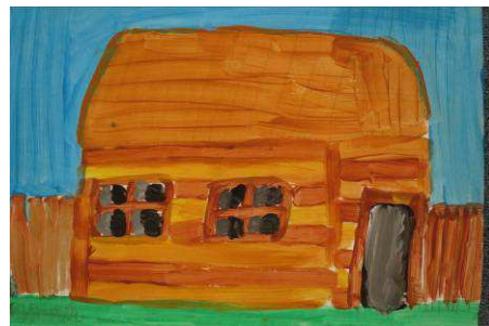
A. Koutná, 4. tř.