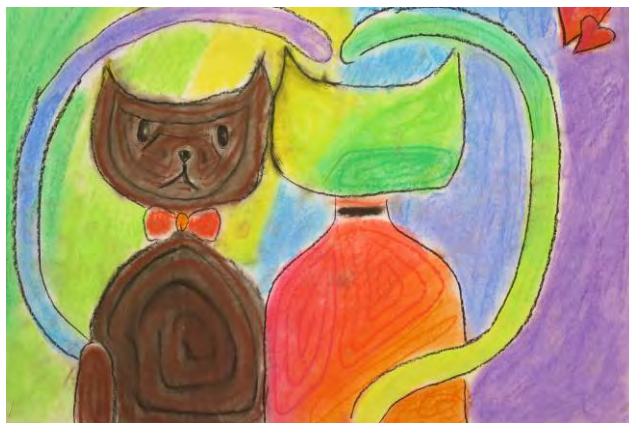
Zuzana Bohunská, 7.tř.

Ve středu 26. 1. proběhly v tělocvičně tradiční Fit-testy. Žáci celé školy a nejstarší děti ze školky v nich měli možnost otestovat si svou tělesnou zdatnost. Rozhodčí z řad rodičů a bývalých žáků školy bedlivě dohlíželi nad správným provedením všech šesti disciplín ( hluboký předklon, skok z místa, stoj – vzpor – stoj, kliky, leh – sed a člunkový běh ), výsledky zpracoval zakladatel této tradice Jan (91 bodů a více) prokázalo