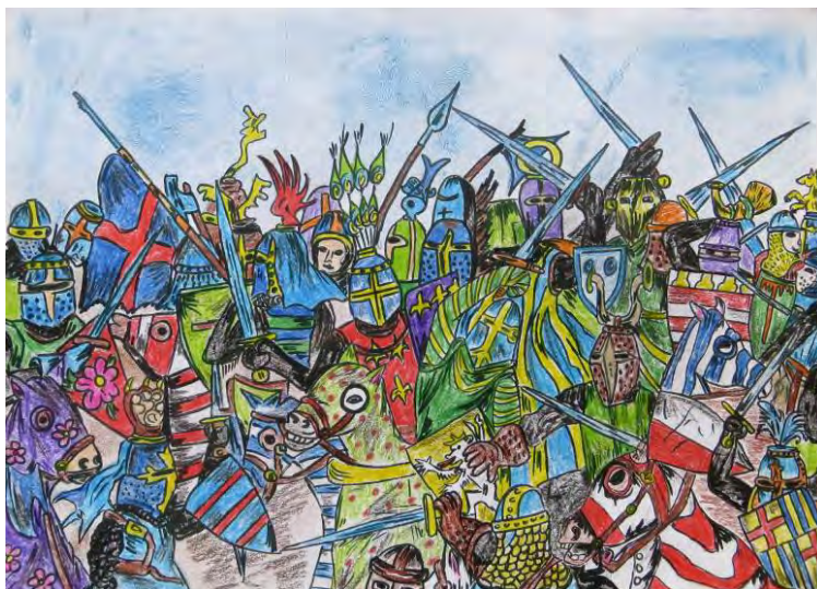
Lukáš Grombíř, 6. tř.

Dne 2. 4. 2016 se konal XII. ročník Přehlídky dětských souborů z Podluží tentokrát v Moravském Žižkově. Přehlídky se zúčastnily také členky našeho folklorního souboru „Věneček“. Děvčata s pásmem „Na lúce“ se mezi deseti soubory neztratila. Všem děvčatům i rodičům děkujeme za výpomoc a čas strávený s námi.