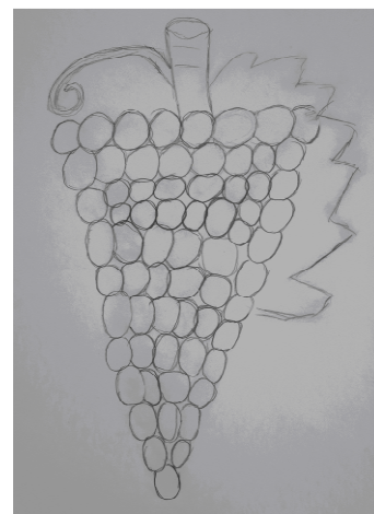
V. Röss, 4. tř.