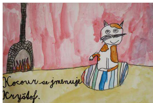
Z. Csápaiová, 3.tř.