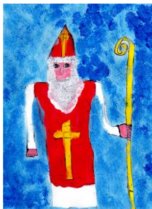
P. Křivová, 5. tř.