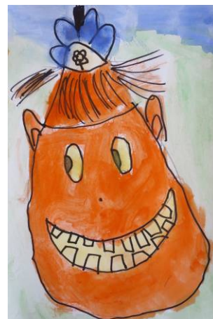
L. Vojtíšková, 1. tř.