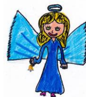
A. Koutná, 5. tř.

Ve čtvrtek 1. prosince ve škole proběhla Vánoční dílnička. Na úvod nám zazpívaly a zahrály děti z hudebního kurzu. V jednotlivých dílnách si návštěvníci vyráběli krásné vánoční výrobky a možná si odnesli i vánoční dárečky pro ty nejmilejší. Po pilném malování, lepení, stříhání a přebíhání z dílničky do dílničky, si všichni mohli odpočinout a posílit se ve vánoční kavárničce, kterou otevřeli žáci sedmé třídy ve školní kuchyňce. Všichni si zaslouží náš obdiv za výrobu kreativních a velmi chutných palačinek, ke kterým podávali ovocný vánoční nealkoholický punč.