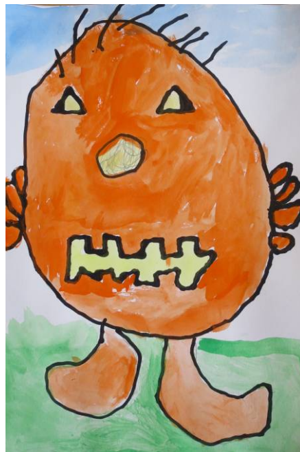
Š. Veselý, 1. tř.