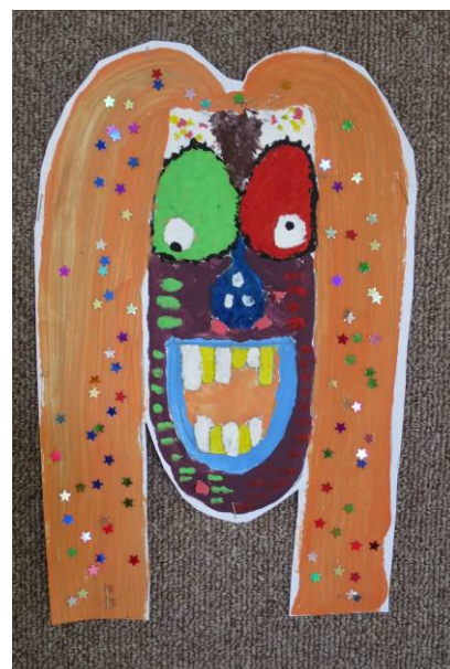
Matyáš Hřebačka, 2. tř.