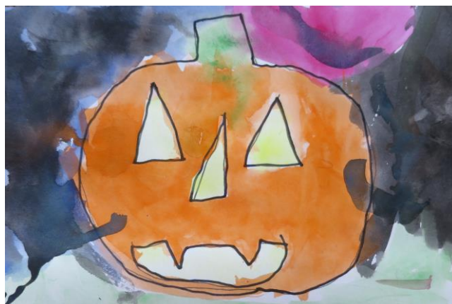
T. Jablonická, 1. B

13. 9. Dýňové pondělí 24. 9. Evropský den jazyků říjen Logická olympiáda 26. 10. Halloweenské učení 3. 12. Čertovské učení