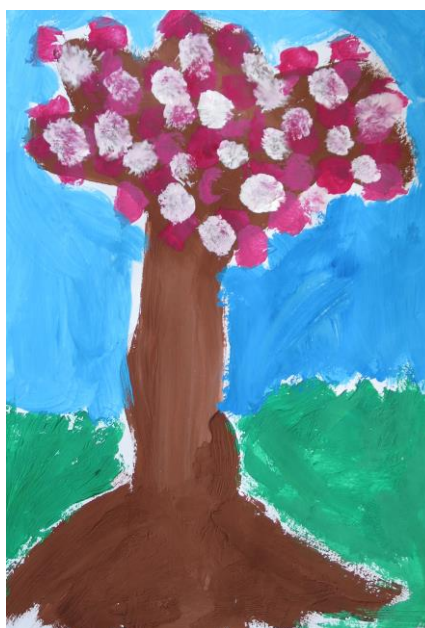
E. Králová, 1. B